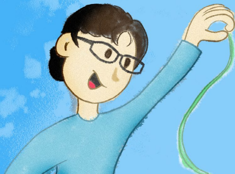
Ilustração: Marcus Munhoz