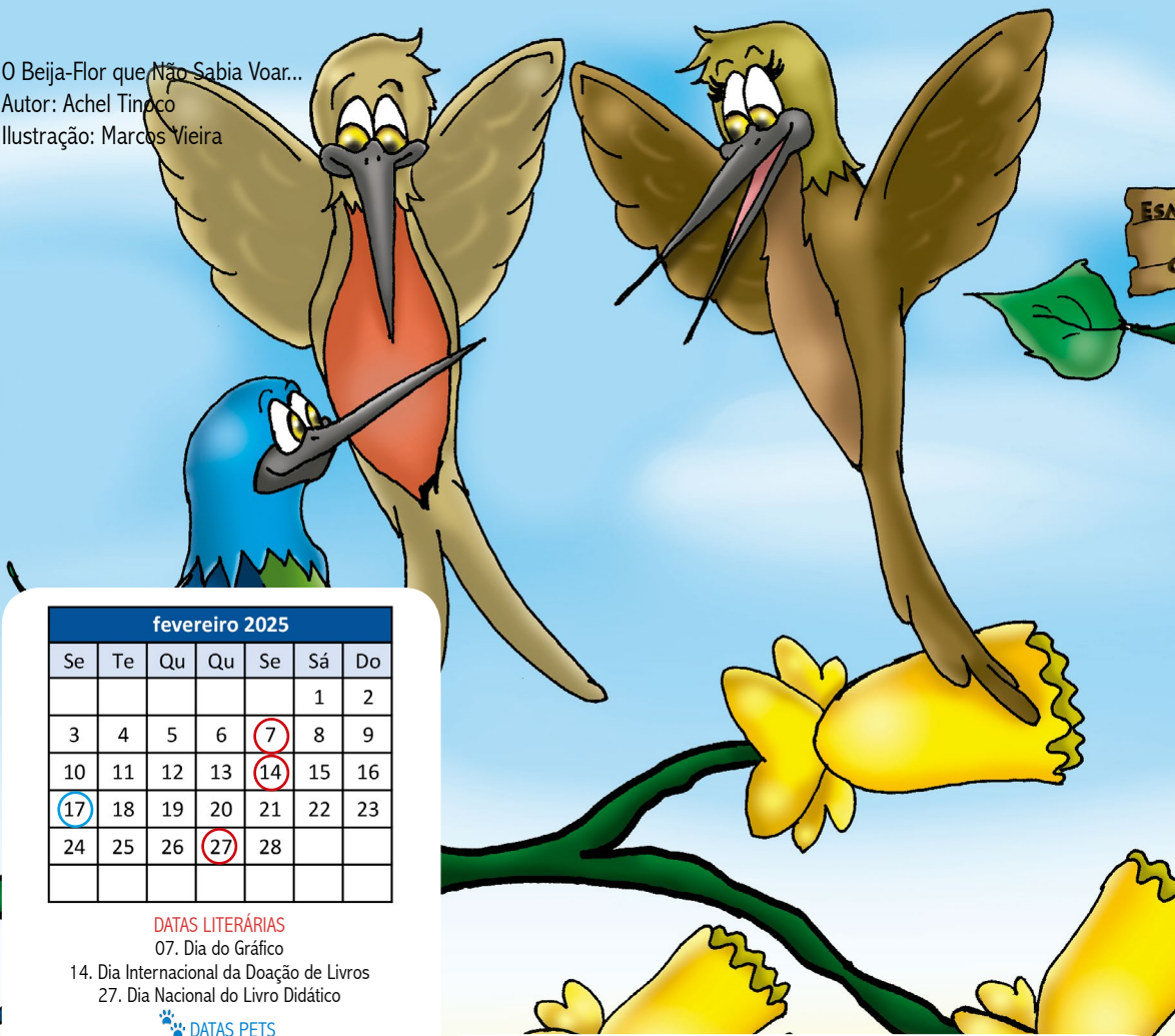
Ilustração: Marcos Vieira