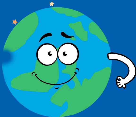
Ilustração: Daniely Andrade